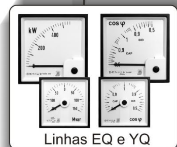
Linhas EQ e YQ