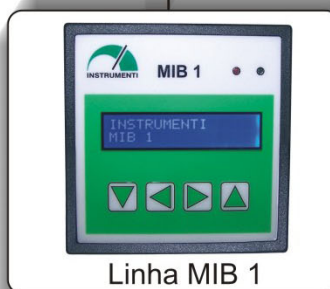
Linha MIB 1